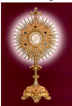
HÃY ĐẾN THỜ LAY