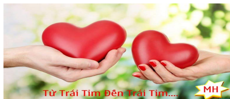
Từ Trái Tim Đến Trái Tim....